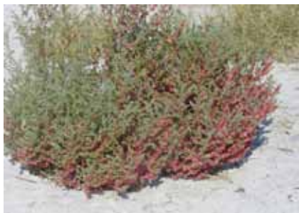
Промышленные галофитные плантации Climacoptera lappata на сильнозасоленных почвах вблизи Аральского моря как альтернативный источник возобновляемой энергии

Два местных сорта топинамбура ( Helianthus tuberosus ) – «Файз Барака» и «Новинка» показали хорошие результаты и хороший потенциал урожайности зеленой биомассы в условиях заброшенных засоленных земель в Тахтакупурской области, Каракалпакстан, а также на засоленных песчаных почвах Кызылкесека, Центральный Кызылкум. Данные солеустойчивые сорта являются экономически выгодными в кормопроизводстве, а также являются возобновляемым источником энергии.