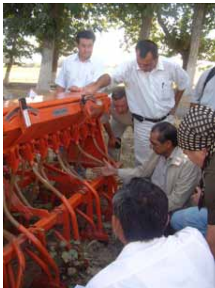
Джиззакская область, Узбекистан: Фермеры обсуждают новое оборудование для ресурсосберегающего сельского хозяйства

В настоящее время, данное оборудование работает исправно, и фермеры, близ лежащих фермерских хозяйств, проводят обработку своих семян для посева пшеницы. Лабораторное оборудование для тестирования семян было установлено в Узбекском Государственном Центре по контролю за качеством семян и сертификации, а также в Галла-Аральском филиале научно-исследовательского института по выращиванию зерновых и бобовых культур в условиях орошения, и в настоящее время применяется для получения сертификата соответствия стандартам ISTA.