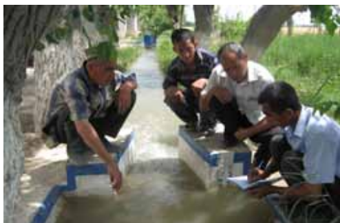
Наманганская область, Узбекистан: Процесс расчета потребления воды в АВП им. К. Салиева

Улучшение продуктивности воды на уровне поля является еще одним проектом ИВМИ в Узбекистане. Целью данного проекта является улучшение продуктивности воды на уровне поля путем распространения знаний по методам орошаемого сельхозпроизводства (агротехнических и гидротехнических практик) среди фермеров. В других странах эта деятельность, как правило, осуществляется специалистами сельскохозяйственных консультативных служб. На сегодня, в странах Центральной Азии формально нет сельскохозяйственных консультативных служб, в связи с чем, была предложена и оценена с точки зрения эффективности в деле распространения знаний о повышении продуктивности воды, новая организационная структура, называемая “Инновационный Цикл”, которая состоит из исследователей, учебных центров, распространителей и фермеров. Для проверки эффективности Инновационного Цикла, были выбраны 25 демонстрационных участков в странах Кыргызстан (5 участков), Таджикистан (5 участков) и Узбекистан (15 участков).