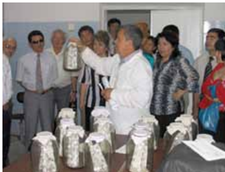
Ташкентский Государственный Аграрный Университет: Объяснение методов разведения хищных клещей

Совместная исследовательская программа по повышению эффективности и производственных линий биологических лабораторий работает над разведением энтомофага хищного клеща. В рамках программы ведется работа над изучением колонизации и акклиматизации хищного клеща Amblyseius sp на мучном клеще, паутинном клеще и других видах жертв в биологических лабораториях Узбекистана. Результаты