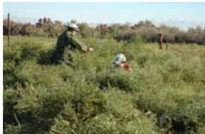
Центральный Кызылкум, Узбекистан: Glycyrrhiza glabra L., ценный дикий галофит, пригодный для реабилитации засоленных почв

Потенциальное воздействие Солодки ( Glycyrrhiza glabra ), для восстановления различных категорий засоленных почв была продемонстрирована международными центрами ИВМИ, ИКБА и ИКАРДА в сотрудничестве с Гулистанским Государственным Университетом. Данная работа была осуществлена в рамках совместного проекта «Яркие пятна», реализованного