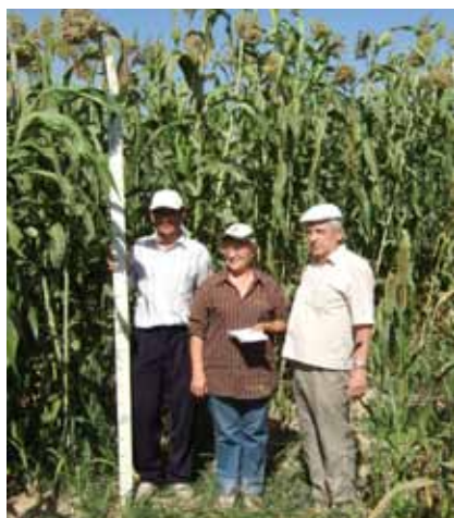
Зангиатинская экспериментальная станция, Ташкентская область, Узбекистан: Сорго, питательная и высокопроизводительная с.-х. культура двойного назначения

Культуры двойного назначения, такие как, просо ( Pennisetum glaucum ) и сорго ( Sorghum bicolor ) являются как высокопитательными, так и высокопроизводительными ранневесенними и летними культурами. Они были введены и оценены, чтобы заполнить существующие пробелы в производстве зерна и кормов в различных агроэкологических зонах Узбекистана. Хотя сорго, в настоящее время, является менее важной культурой (по площади посева), а просо является новой культурой для многих стран региона, высокая урожайность генотипов данных культур является наивысшим показателем относительно других солеустойчивых растений. Они позволят достичь устойчивой эффективности урожайности в условиях высокого засоления, где производство других культур является невыгодным.