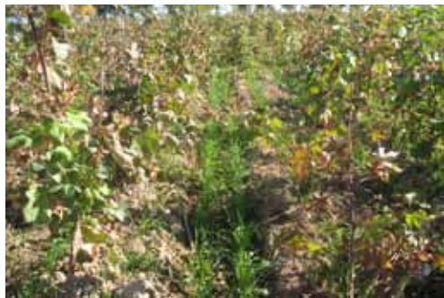
Сырдарьинская область, Узбекистан: Озимая пшеница проросшая на поле хлопчатника

Проект был выполнен МСВХ, посредством проведения технического руководства на участке и поддержки со стороны ИКАРДА и компетентных национальных и региональных институтов и ведомств. Контракт о поддержке включал оказание помощи в становлении и укреплении ассоциации водопользователей (АВП),