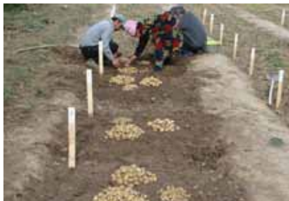
Пскем, Бостанлыкский район, Узбекистан: Урожай семенного картофеля, выращенный из Ботанических Семян Картофеля (True Potato Seed)

В частности, в Гилане на высоте 2800 м над уровнем моря, группа фермеров под руководством СИП получила ряд сортов-кандидатов на размножение и распространение, после осуществления позитивной и негативной селекции. С другой стороны, в Китабе и Пскеме, работа была главным образом сконцентрирована на размножении материалов TPS, произведенных в рассадниках группой женщин.