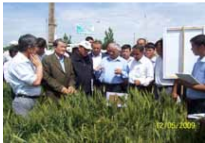
Кашкадарьинская область, Узбекистан: Селекционеры пшеницы обсуждают вопросы улучшения с.-х. культур.

Подобные совместные мероприятия осуществляются между Узбекистаном и ИКАРДА по другим