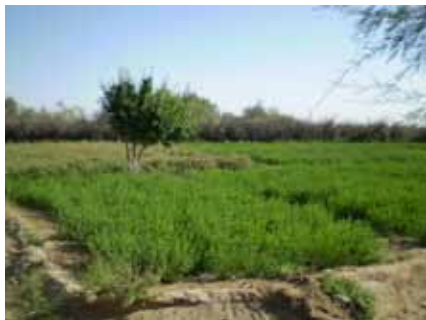
Центральный Кызылкум, Узбекистан: Агролесоводческие испытания по совместному возделыванию многоцелевых деревьев (МЦД) с соле- и жароустойчивой люцерной

Лесоразведение – как мера по смягчению деградации земель, страдающих от различной степени засоления, заболачивания и чрезмерного выпаса скота, требует всесторонней компетентной оценки соответствующих местных и нетрадиционных многоцелевых пород деревьев (МЦПД).