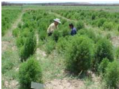
Кызылкесек, Центральный Кызылкум, Узбекистан: Чистые галофитные пастбища (Kochia scoraria) как источник корма

В 2010 году - на основе предыдущих полевых испытаний просо (2006-2009 гг.), проведенных на Узбекской экспериментальной станции зерноводства в сотрудничестве с ИКБА и ИКРИСАТ, был районирован новый перспективный сорт просо двойного назначения «Хашаки-1», в результате скрещивания высокопродуктивных, открыто-опыляющихся сортов «ННВС tall» (ИКРИСАТ) с местными сортами.