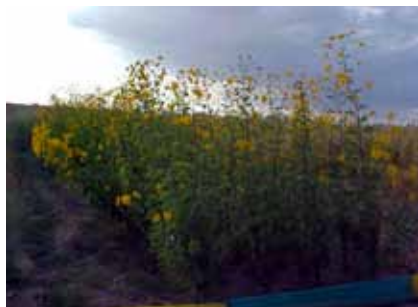
Кызылкесек, Центральный Кызылкум, Узбекистан: Топинамбур (Helianthus tuberosus L.) соле- и засухоустойчивая малоиспользуемая культура на стадии цветения

Два солеустойчивых сорта люцерны ( Medicago Sativa ), «Эврика» и «Скиптер» представленные ИКБА превзошли местный сорт «Хивинский» (используемый