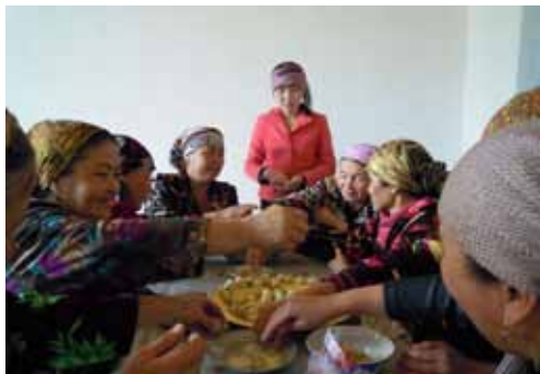
Навоийская область, Узбекистан: Приготовление ужина из с.-х. культур двойного назначения в деревне Папанай

В 2010 году, Международный центр ИКАРДА в сотрудничестве с Международным центром биоземледелия в условиях засоления (ИКБА), в рамках Международной инициативы по изменению климата, начал осуществление проекта «Стратегическая роль культур двойного назначения и мобилизация неиспользованных ресурсов как часть стратегии по изменению климата» (на примере предгорных полупустынных пастбищ вблизи кишлака Папанай, Нуратинского района, Узбекистан), который финансируется Федеральным Министерством окружающей среды, охраны природы и ядерной безопасности Германии. Проект включает в себя сбор дождевых осадков, подпочвенное орошение фруктовых деревьев, использование фуражных кустарников, а также разработку местных стратегий по адаптации к климатическим изменениям и создание малых цепочек наращивания стоимости по культурам двойного назначения и красильным растениям. Жизнедеятельность людей в этом регионе в настоящее время, в основном, зависит от продуктивности выращивания виноградников и животноводства (основанного, частично, на пастбищах и частично на производстве люцерны). Животноводы уже столкнулись с проблемой дефицита кормов, связанного с деградацией пастбищ. К тому же, согласно SNC-UZB (2009) производство люцерны может сильно сократиться в условиях изменения климата. Поэтому производство кормов должно быть диверсифицировано и расширено.